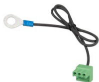
Connecteur avec un câble négatif CC préassemblé (inclus)