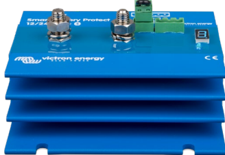
Smart BatteryProtect BP-220