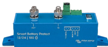
Smart BatteryProtect BP-100